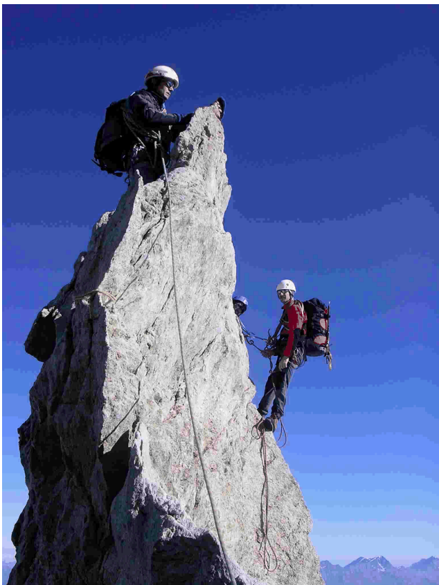
Rasoir, beim Aufstieg auf Zinalrothorn

Am Sonntagmorgen um 07:00 Uhr fahren die 4 Teilnehmer gemütlich nach Sierre. Ab Sierre gings mit dem Postauto weiter nach Zinal. Nun folgte ein abwechslungsreicher Hüttenweg am Fusse des Besso und Mam- mouth entlang zur Mountethütte. Bei war- men Temperaturen und herrlicher Ge- birgswelt genossen wir den Nachmittag.