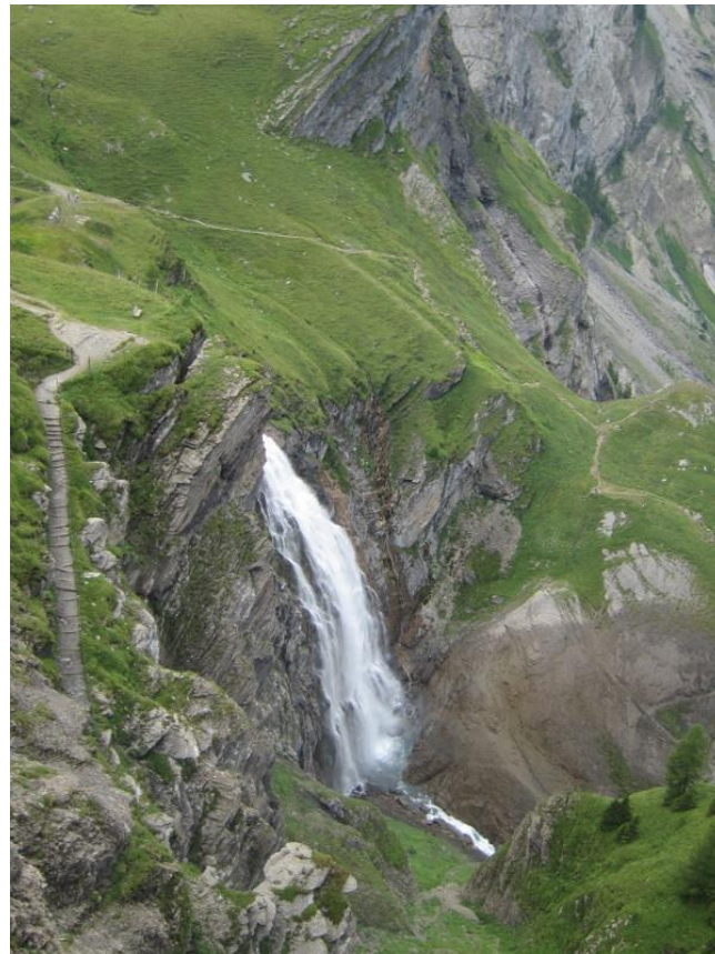
Der obere Engstligenfall