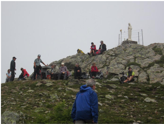
Auf dem Col d`Anzana

Campascio und weiter hoch via Cavaione ins Val dal Saient zur Alp Pescia Bassa (1832 müM). Hier werden die Autos parkiert und dann marschieren wir via Rifugio Anzana zum gleichnamigen Pass, wo wir neben der uns von früheren Touren bekannten Madonna eine Pause einlegen. Das Wetter ist so-la- la. Manchmal Wolkenverhangen, manchmal aufgelockert. Nun gut, weiter geht's auf den Piz Cancan (2433 müM), wo wir wenigstens teilweise Sicht aufs Veltlin geniessen, resp. Erahnen können, Dieses Tal, das zwei Jahrhunderte zur Schweiz gehörte, liegt eindrückliche 2000 m tiefer! Dann marschieren wir weiter Richtung Norden zum Bergsee Regina. Dieser ist wunderbar eingebettet in die Landschaft.