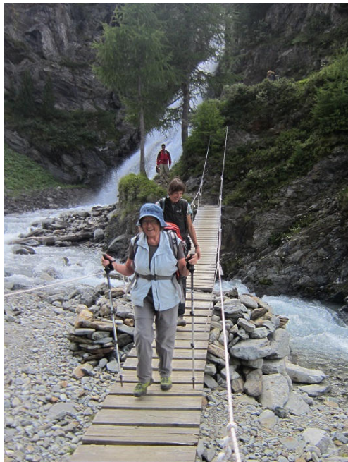
Über diese Brücke müssen wir gehen

Nun weiter Richtung Fahrstrasse Livigno - Berninapassstrasse und vor Erreichen derselben über Wiesen und durch Wald zur Endstation des „grünen“ Lokalbuses von Livigno. Die Fahrt mit diesem Bus ins Zentrum zeigt, dass Livigno wirklich ein nicht endendwollendes Strassendorf ist. Leider wurde die Zeit nun derart knapp, dass es nicht mehr reicht zum zollfreien Shoppen, denn wir dürfen den letzten Bus zurück in die Schweiz um 16:40 nicht verpassen. Via La Mott, der Zollstation an der Berninapassstrasse und einem anderen Postauto kehren wir um etwa halb sieben Uhr zurück nach Le Prese.