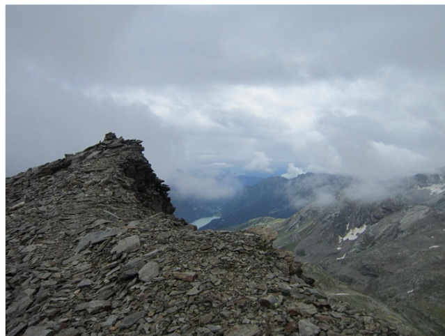
Die Cima Val Fontana

müM). Wir machen beim nahe gelegenen italienischen Biwak Pause, bevor es weiter geht, meist weglos Richtung Norden zu einem namenlosen Pass südlich des Piz Varuna auf etwa 2850 müM gelegen. Das Wetter ist nun leider nicht mehr sonnig; fast alle Gipfel sind in Wolken eingehüllt. Trotzdem steigen die meisten unserer Gruppe noch hoch auf den Gipfel des Cima Val Fontana (3070 müM), wo zumindest die Aussicht auf den Stausee im Süden und den Fellariagletscher im Norden bewundert werden kann.