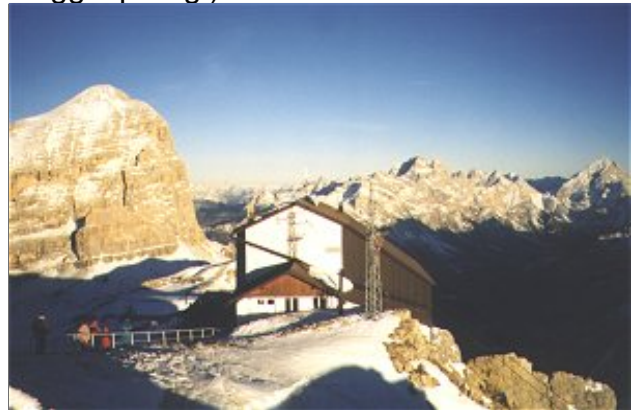
Der Lagazuoi.

Montag (gutes Wetter): Ab Montag war dann „Erwin“ für uns verantwortlich und hat uns mit seinem Kleinbus abgeholt, so war das dann jeden Tag. Um uns kennenzulernen und unsere Fähigkeiten einschätzen zu können, wählte er als ersten Kletterberg den „Piccolo Lagezuoi“ (Via del Buco; 5, das meiste 3-4er Schwierigkeit, ca. 8 Seillängen) beim Falzeregopass aus, einen der vielen Schauplätze des 1. Weltkriegs (einen Teil vom Berg haben sie weggesprengt).