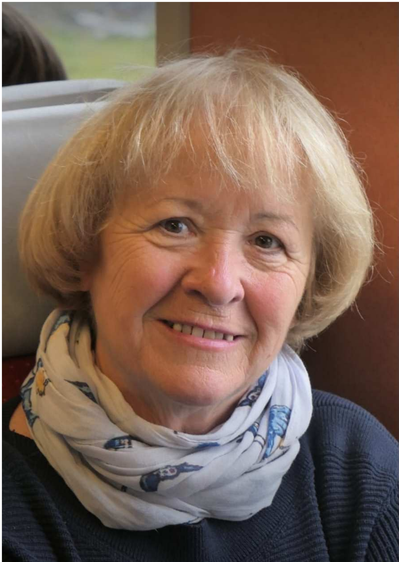
aus der SeniorInnen-Wanderwoche in Sils-Maria im Sommer 2018