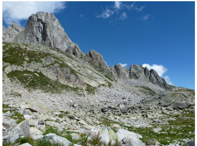
Bergseeschijen und Hochschijen

Tel: 079 912 83 87 oder moll40@bluewin.ch