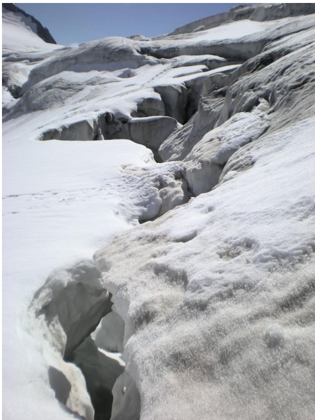
Auf dem Steingletscher

Zum Saisonstart wieder einmal auf den Steig-eisen stehen. Seilhandhabung üben, Eis-schrauben setzen, mit dem Pickel arbeiten, usw.