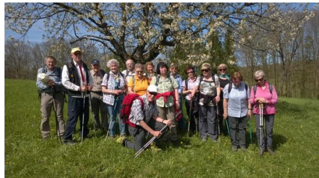
Es fehlen nur die beiden B-Wanderer und der Fotograf!

Der Nachmittag fing an mit einem kurzen Postautotransfer bis zum Scheitelpunkt unserer Tour in Fehren, ehe wir durch Wald, Wiesen und Kirschbaumgärten nach Breitenbach hinunterwanderten.