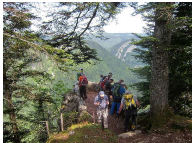
Belvédère des Requettes

Tourenleiter: Sepp Baumgartner Anzahl Teilnehmer: 12