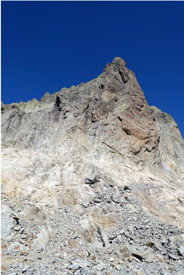
Undertalstock S-Grat 4c obl. / Ostwand 5b+ obl.