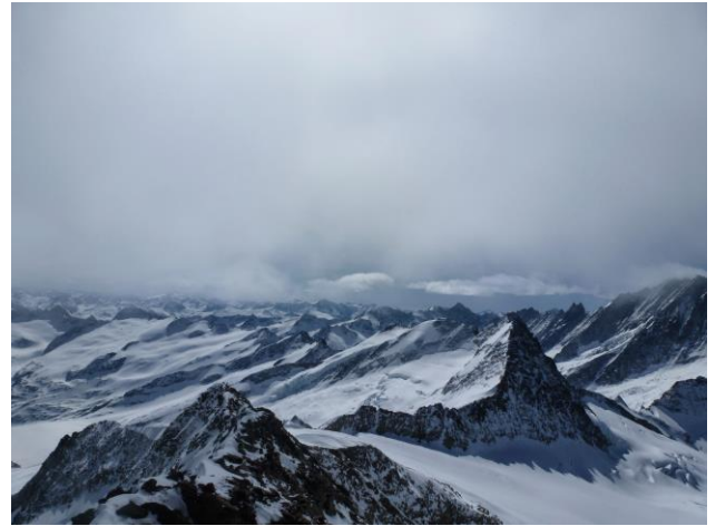
Bildmitte rechts Bärglistock N-Grat