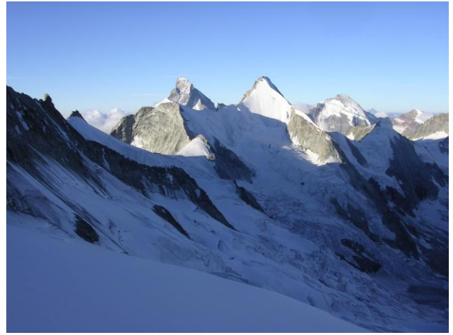
Wellenkuppe, Matterhorn, Obergabelhorn

Besammlung: Wird an der Besprechung bekannt gegeben