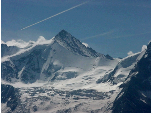
Zinalrothorn, ein Tourenziel 2005 des SAC