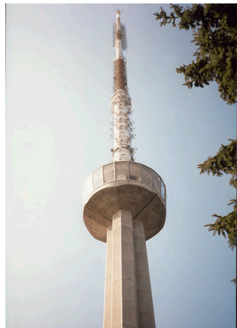
Funkturm auf dem Uetliberg