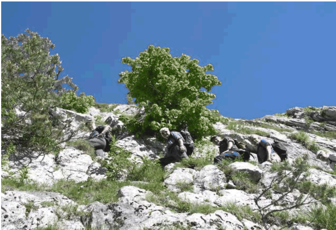
SAC'ler beim Aufstieg auf die Simmenfluh, im Felsen kein Problem, Franz Pellissier