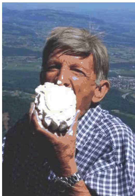
Genuss pur auf der Simmenfluh