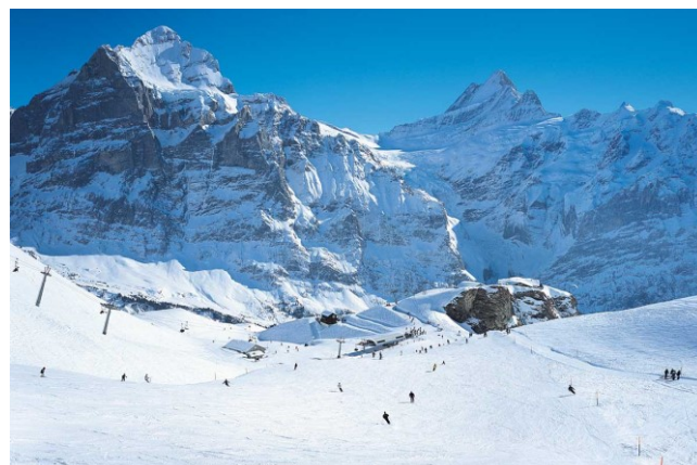
“First-Bild“ mit Wetterhorn und Schreckhorn (aus dem Internet, keine Zeit für Fotos!)

Die Unermüdblichen hatten aber noch vor 3 Uhr genügend Weisses und allmählich kein Relief mehr gesehen.