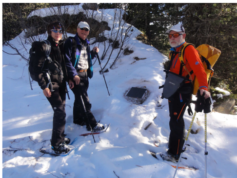
Drei Teilnehmer vor der Gedenktafel für Paul Flüeli bei der Saoseo Hütte

Da die Situation im Ferienhaus wegen Wassermangel im Winter das Duschen nicht zulässt, entscheiden wir uns für einen abendlichen Besuch im Hallenbad von Poschiavo. Eine Person besucht nur die Dusche und verlässt den Ort ohne jeglichen Wasserkontakt im Bad! Anschliessend fahren wir nach Tirano in eine Pizzeria und geniessen – zum einzigen Mal in dieser Woche – ein Essen in einem Restaurant. Mit anderen Worten: Bis auf diese Ausnahme haben wir immer selbst gekocht und zwar mit persönlichem Einsatz aller Teilnehmenden. Die Mahlzeiten wurden jeweils in unterschiedlichen Teams mit grosser Professionalität gekocht.