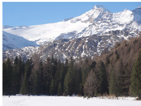
Sicht aus dem Val da Camp auf den Palügletscher und den Piz Palü

Nachdem eine Teilnehmerin in Bad Ragaz vergeblich auf das Auto der anderen drei wartet – weil wir in Landquart abgemacht hatten – und der Irrtum mit einer Zusatzschleife ausgebügelt worden war, geht die Fahrt weiter durch den Vereinatunnel und den Berninapass ins Puschlav und dort auf die Alp Zavena oberhalb von Viano.