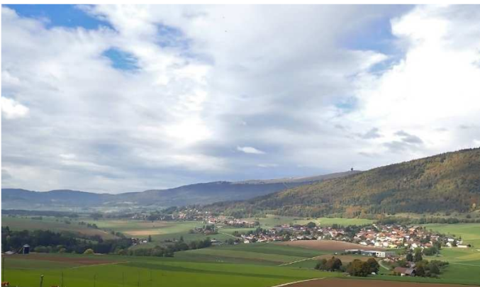
Im Abstieg zur Schlucht hatte man einen schönen Ausblick auf das Plateau de Diesse mit den Ortschaften Lamboing und Diesse sowie den Chasseral mit seiner markanten Antenne. Auf der kleinen Fahrstrasse, mit wenigen Ab- und Aufstiegen, wanderten wir durch die Schlucht Richtung Schernelz.