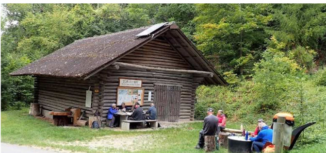
Beim Waldhaus der Burgergemeinde Ligerz gab's die Mittagspause, begleitet von einigen

Regentropfen. Die meisten bemerkten es nicht einmal, so schnell war es vorbei.