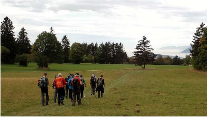
Am Restaurant Hohmatt vorbei, durch Feld und Wald von Les Prés de Macolin ging es der Twannbachschlucht entgegen.