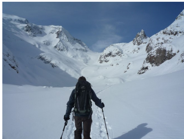
Blick links zum Vorder Tierberg mit NE-Wand

Die Abfahrt führt über die Aufstiegsroute zurück.